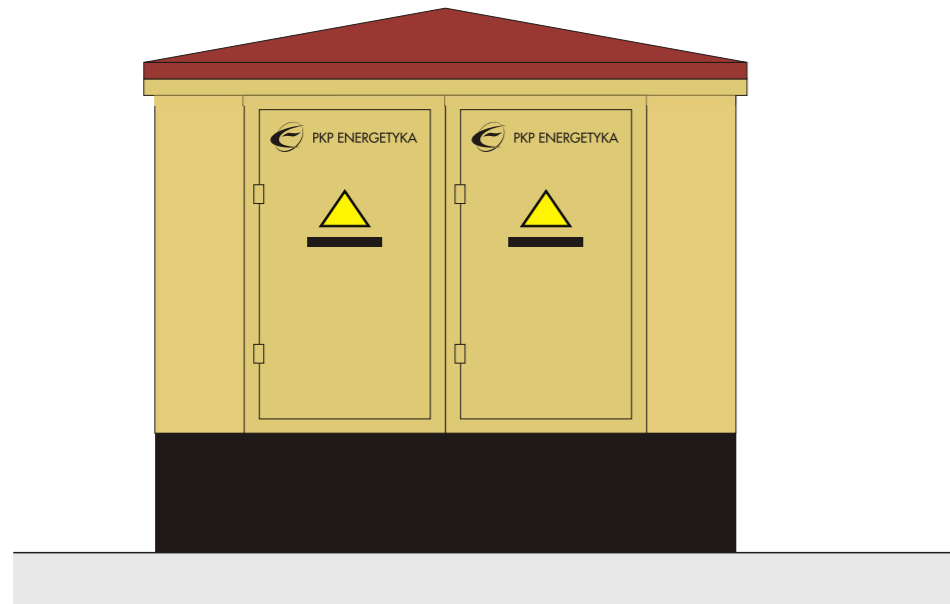
stacja transformatorowa lubelska małogabarytowa w obudowie betonowej typu STLmb-3

- kolor elewacji: Kolor NCS S2020-Y20R jest kolorem dominującym, kolor NCS S1020-Y20R jest przewidziany dla dodatków, np. pasów okiennych - drzwi: kolor piaskowy dopasowany do koloru elewacji. - znak: wersja achromatyczna.