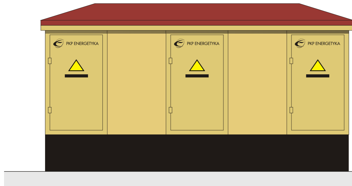
stacja transformatorowa lubelska małogabarytowa w obudowie betonowej typu STLmb-6