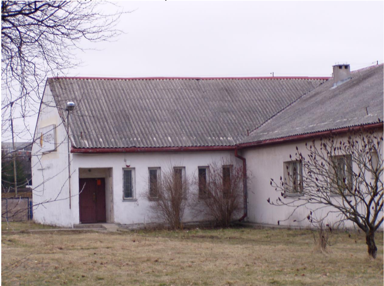
Rys. 1 Elewacja od strony południowo-zachodniej.

PKP Energetyka S.A. Oddział Usługi Sekcja Zasilania Elektroenergetycznego ul. Sikorskiego 23, 19-300 Elk