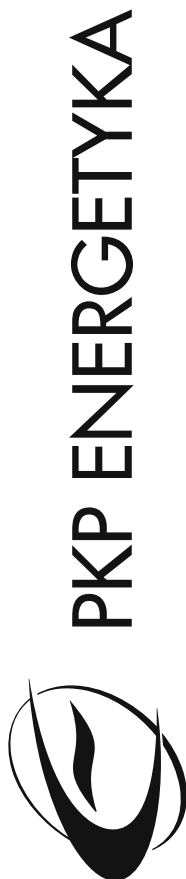
forma uproszczona znaku

Zawsze należy stosować go z logotypem. Poniżej przedstawiono konstrukcję znaku w formie uproszczonej opartej na siatce modułowej, gdzie modułem jest kwadrat o boku równym połowie szerokości litery "N" w logotypie firmowym.